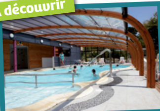
Piscine couverte, Balnéo hammam (du 31/03 au 23/09)

Indoor swimming pool, Spa, hammam (from 31/03 to 23/09)